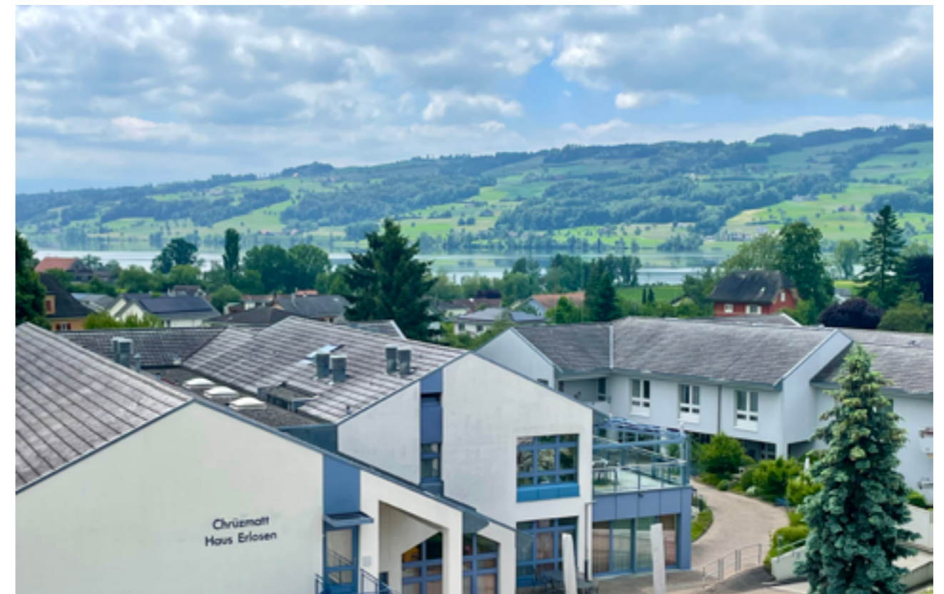
Aussicht aus dem Haus Lindenberg