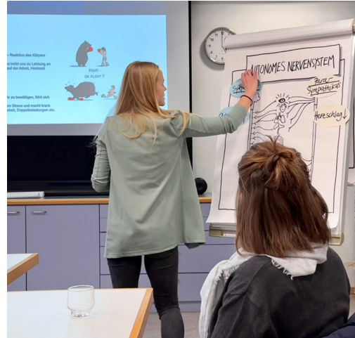
Am Workshop lernen die Teilnehmenden die Auswirkungen der Atmung auf unser Nervensystem.

– ein Effekt, der auch wissenschaftlich belegt ist. Besonders eindrücklich waren die Messungen mit dem